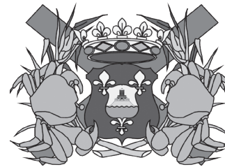
Ville de MORNE À L'EAU